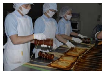
上から攪拌、焼き上げ、手巻き作業の各工程（つきじ入船浦安工場で）