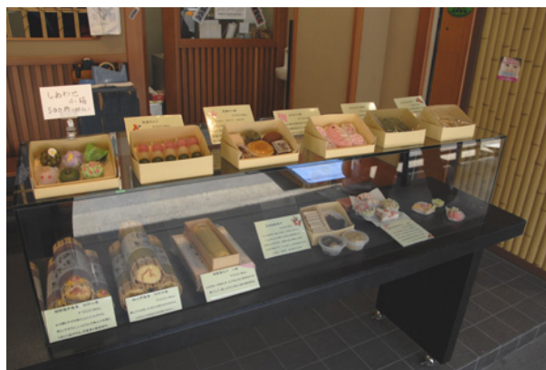
「つきじ入船 笑楽」店頭風景。和菓子とともに名物の伊達巻も並ぶ。喧騒、乱雑、男性的な築地にあって、静謐、粹、女性的な佇まいが特徴的だ。